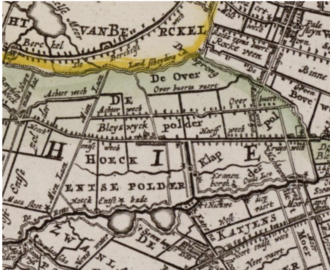
Bleiswijk rond 1600